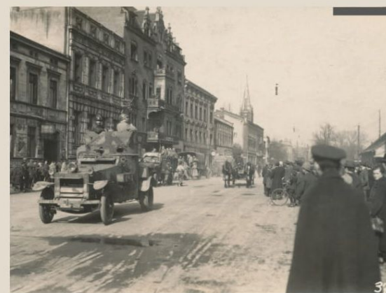
Francuski samochód pancerny na Bahnhofstrasse (ul. Dworcowa) w Gliwicach, 26.06.1921 r.